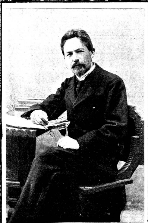
А. П. Чеховъ.

Къ десятилѣтію со дня кончины. (1904 — 2 іюля — 1914 г.)