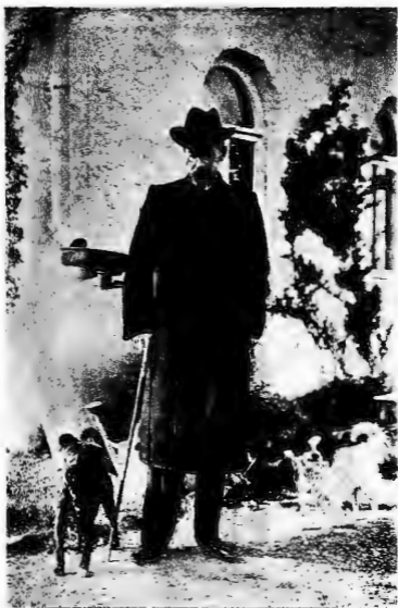
А. П. Чеховъ и его любимыя собачки.