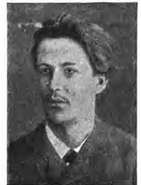
А. П. Чеховъ въ 1884 г., тотчасъ по окончаніи курса университета.

Послѣ спектакля иногда урывалъ часъ — другой и прѣзжалъ А. И. Южинъ; вмѣстѣ съ нимъ выступали на очередь театральныя темы, а красное вино замѣнялось шипучимъ.