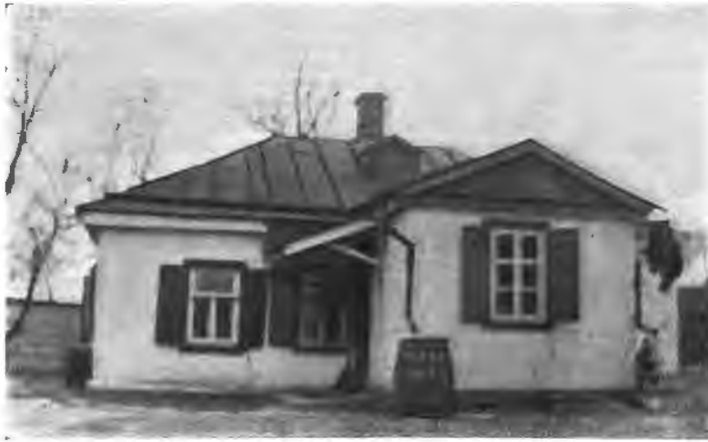
Домъ, въ которомъ родился А. П. Чеховъ (Таганрогъ, Чеховская улица 47), написавъ первая свои произведения и проживавъ во время прїздовъ въ Таганрогъ.