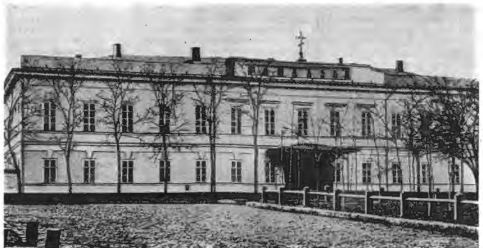
Таганрогская мужская гимназія, въ которой учился А. П. Чеховъ.

И это, видимо, доставляло ему искреннее удовольствіе. Глядя на его лицо, казалось, что въ такіе часы онъ чувствовалъ себя ребенкомъ.