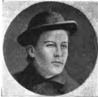
А. П. Чеховъ—студентъ (1881 г.).

Читая многочисленныя воспоминанія о Чеховѣ, я получаю странное впечатлѣніе: все какъ будто боится, чтобы онъ хоть на минуту не показался чело-вѣкомъ съ горячею кровью, съ живыми человѣческими страстями и человѣческими слабостями.