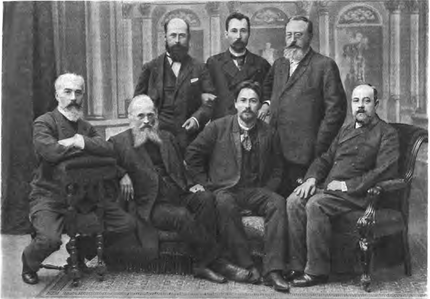
Редакція и сотрудники журнала „Русская Мысль“. Группа, снятая во время пребывания А. П. Чехова въ Москвѣ.