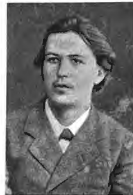
А. П. Чеховъ—студентъ (IV курса).