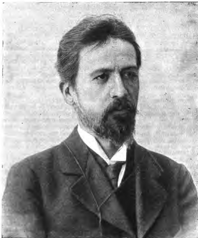
А. П. Чеховъ.

И ужъ тутъ была обязательна его рѣчь — своеобразная, почти отъ начала до конца казавшаяся безнадежно-запутанной, съ отступленіями, съ полутными анекдотами, съ невѣроятными, но необыкновенно характерными словеч-