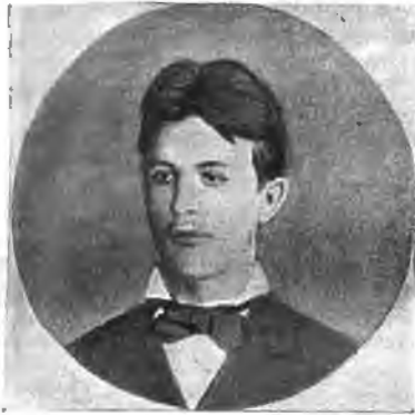
А. П. Чеховъ въ 1879 г. тотчасъ по получении аттестата зрѣлости.

Можетъ-быть, это оттого, что наибольше искрення воспоминанія относятся къ послѣднему періоду его жизни, къ тому времени, когда полную власть надъ его организмомъ взяла болѣзнь, и онъ, сознательно или нѣтъ, тщательно берегъ свои силы. Обстоятельства такъ сложились, что въ эти годы, прожитые имъ въ Крыму, я его не видѣлъ.