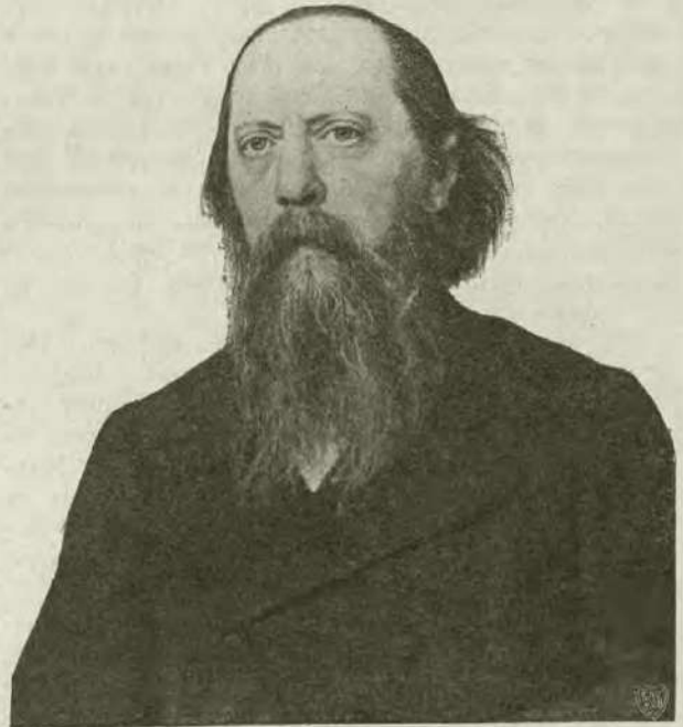
М. Е. Салтыковъ (Шедринъ).