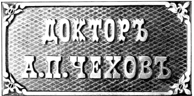
Доска, висѣвшая на дверяхъ квартиры въ Москвѣ, гдѣ жилъ Чеховъ.

Чеховъ досталъ десятирублевку, повернулъ и бросилъ на столъ, какъ будто она жгла ему руки. Но затѣмъ распечаталъ какое-то лежавшее на