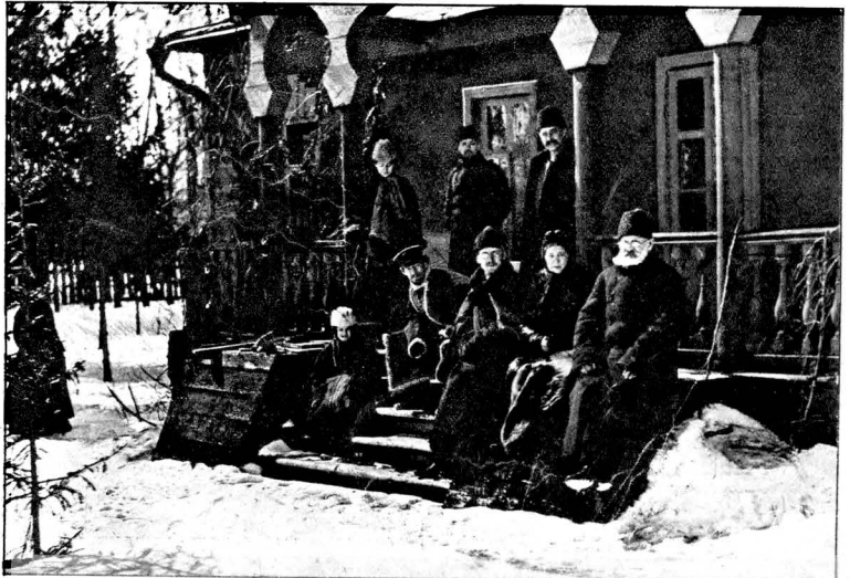
Семейство Чеховыхъ въ Мелиховѣ.